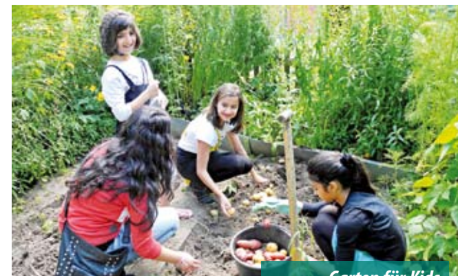
Garten für Kids